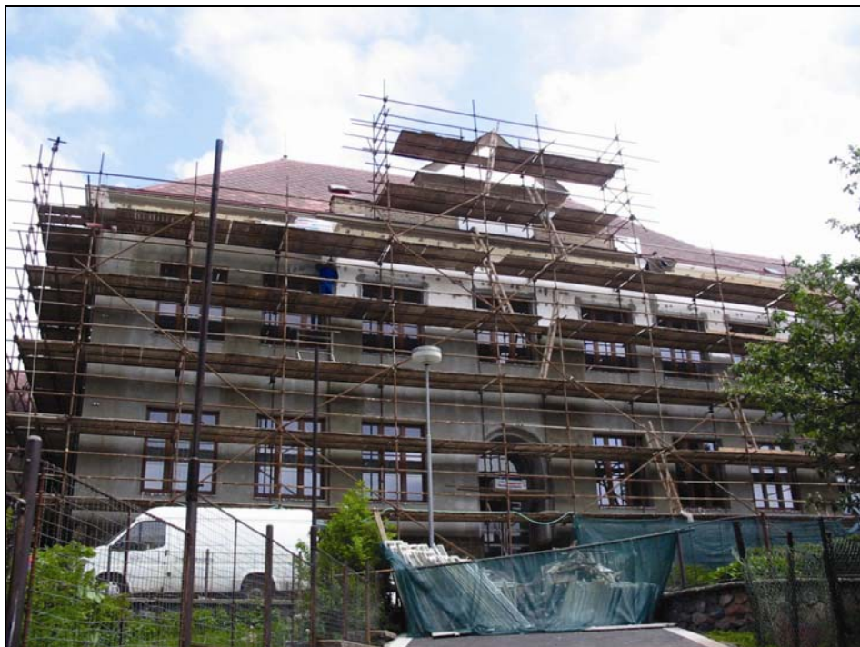
Zhotovení zateplené fasády na ZŠ

Komunikace- převažují výdaje na zimní údržbu MK, čištění chodníků, částka ve výši 236 310,-- Kč ze schváleného rozpočtu nebyla použita na opravu náměstí vzhledem k tomu, že obec neuspěla s žádostí o dotaci na opravu náměstí z projektu MAS Pohoda venkova.