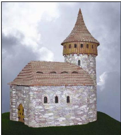
Maketa hradu Frymburk od Jarmily Haldové

Na základě Smlouvy o bezúplatném převodu pozemků parcelní číslo 820/8, 820/11, 820/15 a 820/16 mezi Pozemkovým fondem České republiky a Městysem Nový Hrádek ze dne 25.4.2007 získal městys 11112 m 2 pozemků (nad „stadionem“) určených k zastavění veřejně prospěšnou stavbou nebo stavbou k bydlení či k realizaci zeleně.